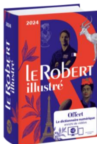
Le Robert illustré 2024

皆さんはどんな辞書を使っていますか。フランス語の 2 つの辞書をご紹介します。写真やイラスト付きなので見るだけでも楽しくなります。紙の手触りや辞書に線を引くのもモチベーションがあがりますね！